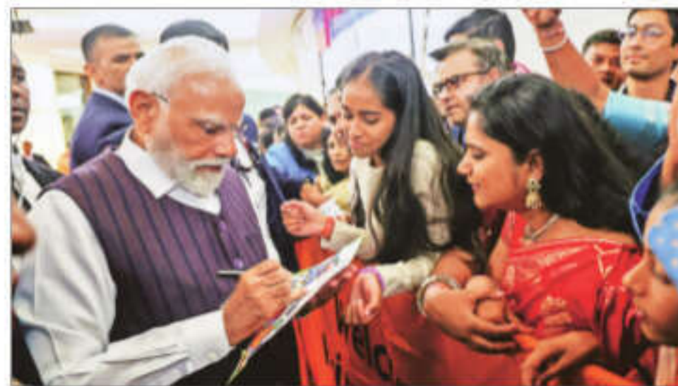
Prime Minister Narendra Modi being welcomed by the Indian diaspora in Johannesburg on Friday

"Landed in Johannesburg for the G20 Summit related